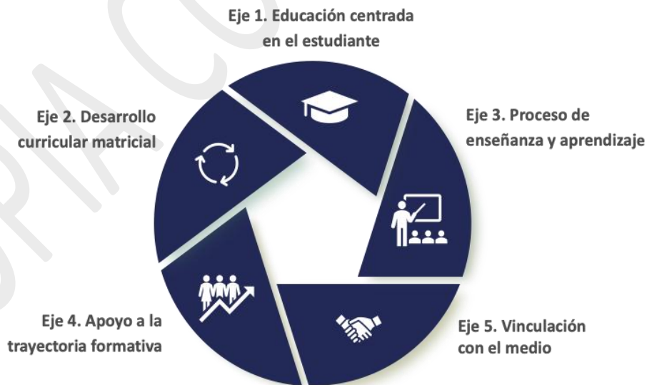
Figura 1. Ejes del Modelo Educativo IPG (2024).

En el contexto actual, marcado por rápidos cambios económicos, tecnológicos y sociales, la educación técnico-profesional juega un papel importante en la formación de los futuros trabajadores. Reconociendo esta realidad, el modelo educativo de IPG adopta enfoques pedagógicos sustentados en principios sociocognitivos, sistémicos, conectivistas y andragógicos. Además, en esta actualización, se destaca la integración de tres ejes fundamentales para promover la integralidad de la formación de nuestros estudiantes. De esta manera, se describen los cinco ejes fundamentales: educación centrada en el estudiante, desarrollo curricular matricial, proceso de enseñanza y aprendizaje, apoyo a la trayectoria formativa, y vinculación con el medio, asegurando la coherencia y efectividad del proceso educativo.